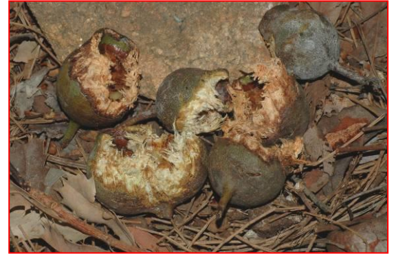
جوز شجر المري مقصوم من الكوكاتو الاسود ذو الذيل الاحمر