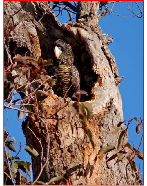
أنثى الكوكاتو الاسود ذو الذيل الاحمر في العش