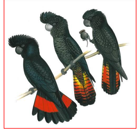
حدث (يمين)، أنثى (وسط)، ذكر (يسار)